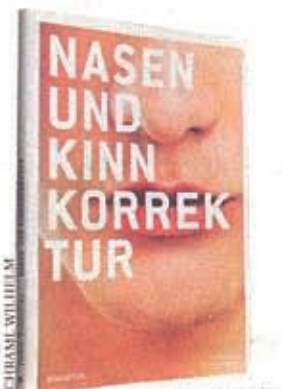
Edvin Turkof, Elis Sonnleitner: Nasen- und Kinnkorrektur, 19,90 €, Maudrich-Verlag

Die einzige rein medizinische Indikation für eine Nasenoperation ist für beide Experten übrigens eine funktionelle Störung, etwa eine eingeschränkte Atmung. Die psychische Belastung sei jedoch nicht außer Acht zu lassen, so Vinzenz: „Oft liegt das Problem aber ganz woanders als im vermeintlichen Schönheitsmangel.“