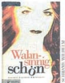
Kritischer Blick auf den Körperkult

Turkof u.a.: Eigenfett, Botox & Filler , 100 S., 16 Euro; Ohrkorrektur , 80 S., 14,90 €; Maudrich Verlag.