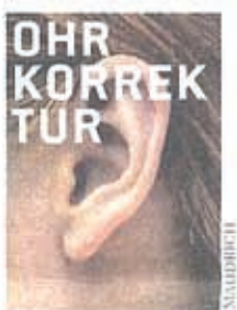
Ratgeber bei Ohrkorrekturen